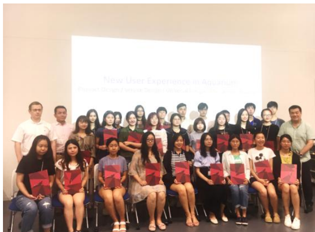
(往届线下课程结业证书颁发现场)