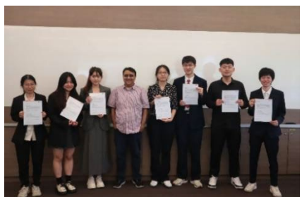
颁发优秀学员证明