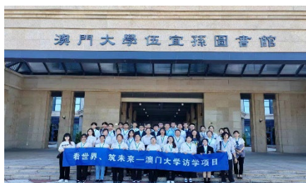
参访交流：澳门大学