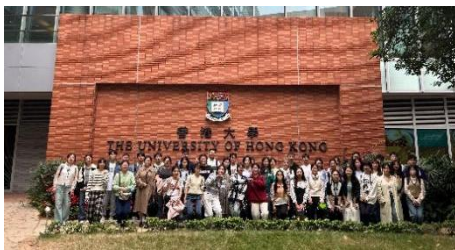
参访交流：香港大学